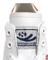
▲タンのブランドネーム