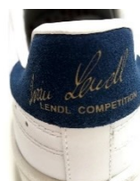
▲レンドルのシグニチャー